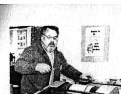
Alpirsbach: Drucken wie der Gutenberg Seite 26

Die Druckstöcke hütet Kilgus wie ein Juwel. Da gibt es die Szene „Moses hütet seine Schafe“ (2. Mose 3) oder